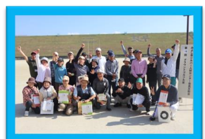
～第18回グラウンドゴルフ大会風景～ 【令和6年11月12日開催】