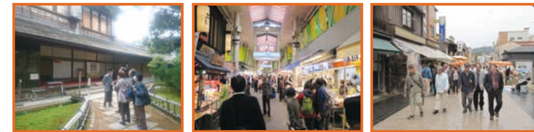
「金沢兼六園」 「近江町市場」 「輪島朝市」