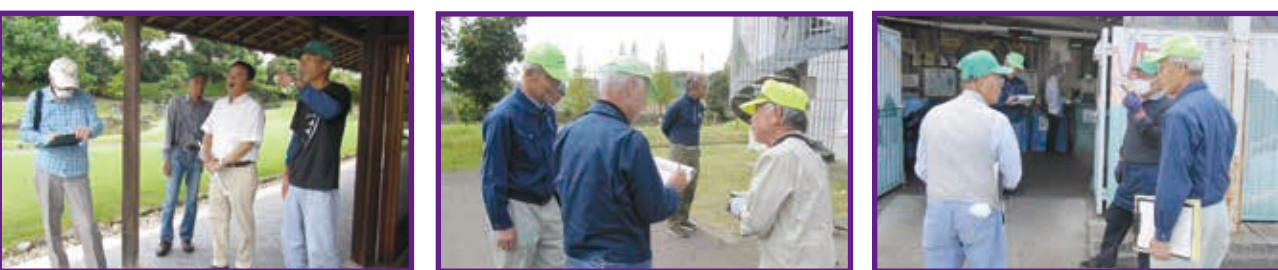
「文化センターサンアート」 「学校法人東海学園大学」 「みよし市リサイクルステーション」

各就業先において、会員の健康管理を第一に、就業環境の再点検を行い、安全で適正に就業を行っていただくための巡回活動を実施しました。