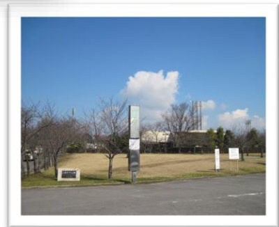
南部地区コミュニティ広場

今日のコースは特別！ 山あり、谷あり登ったり、 下ったり・・・ がんばってください！！