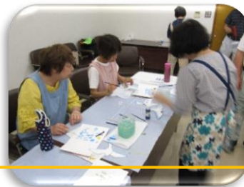
作品：オーナメント